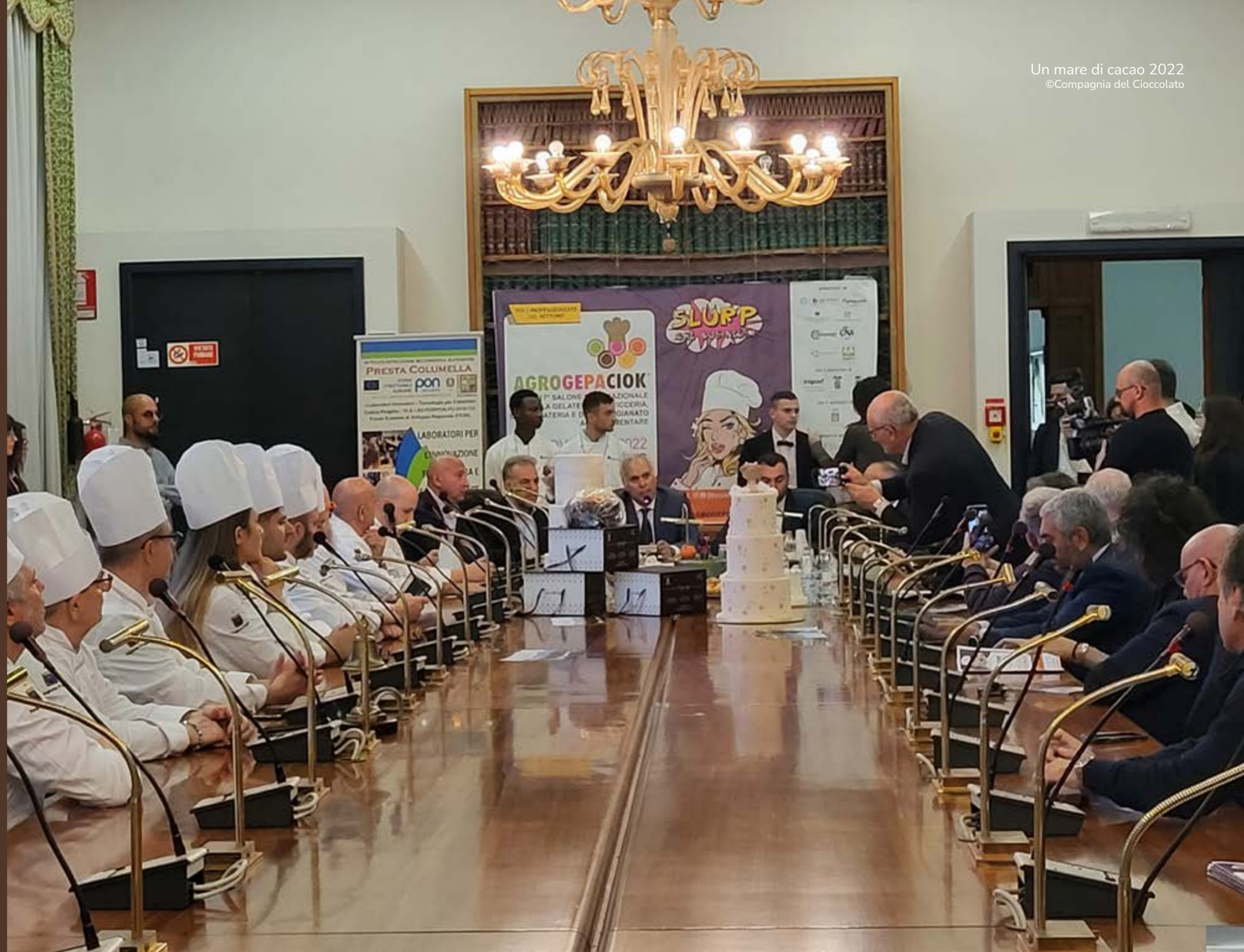
Conferenza stampa in Camera di Commercio a Lecce