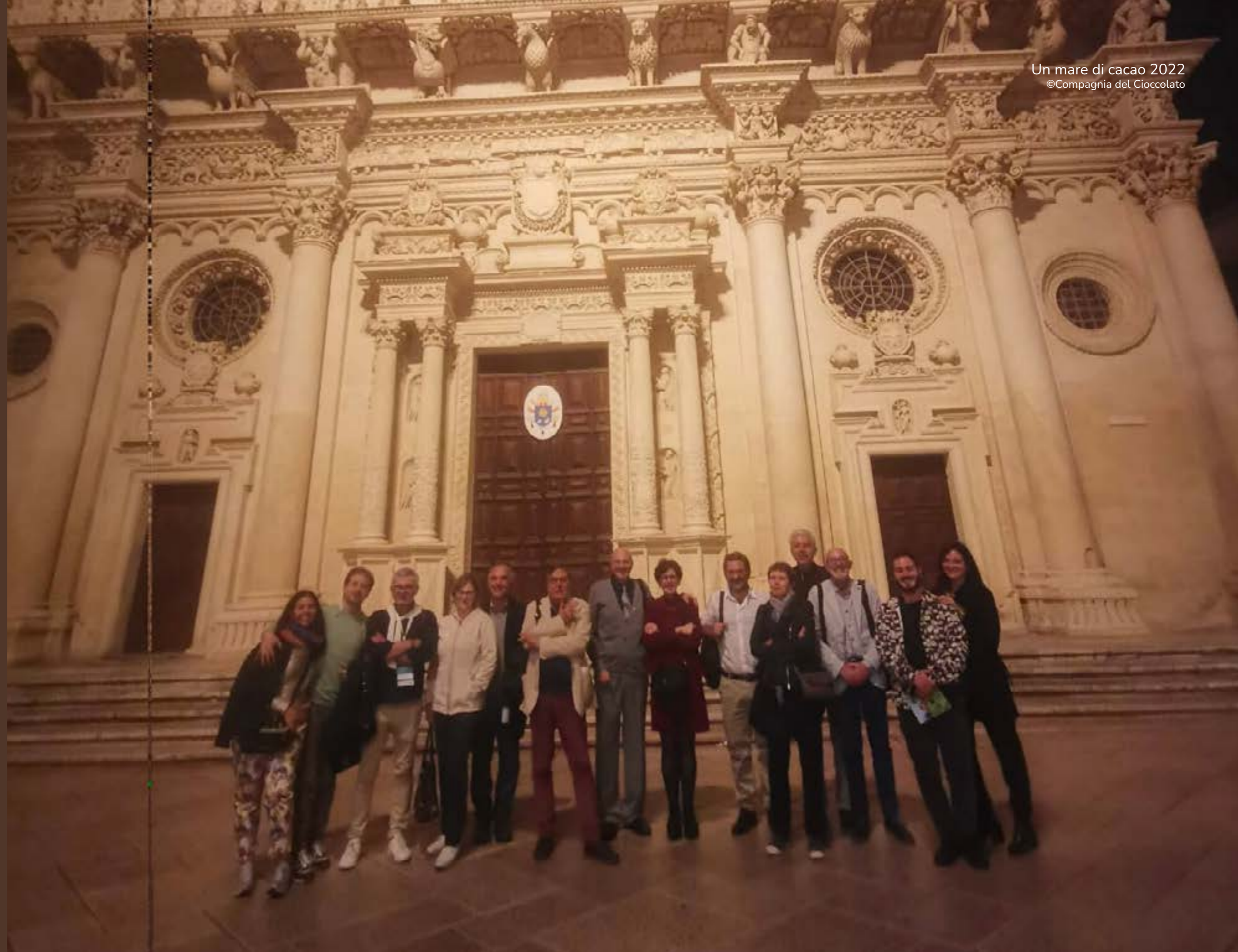
La squadra al completo