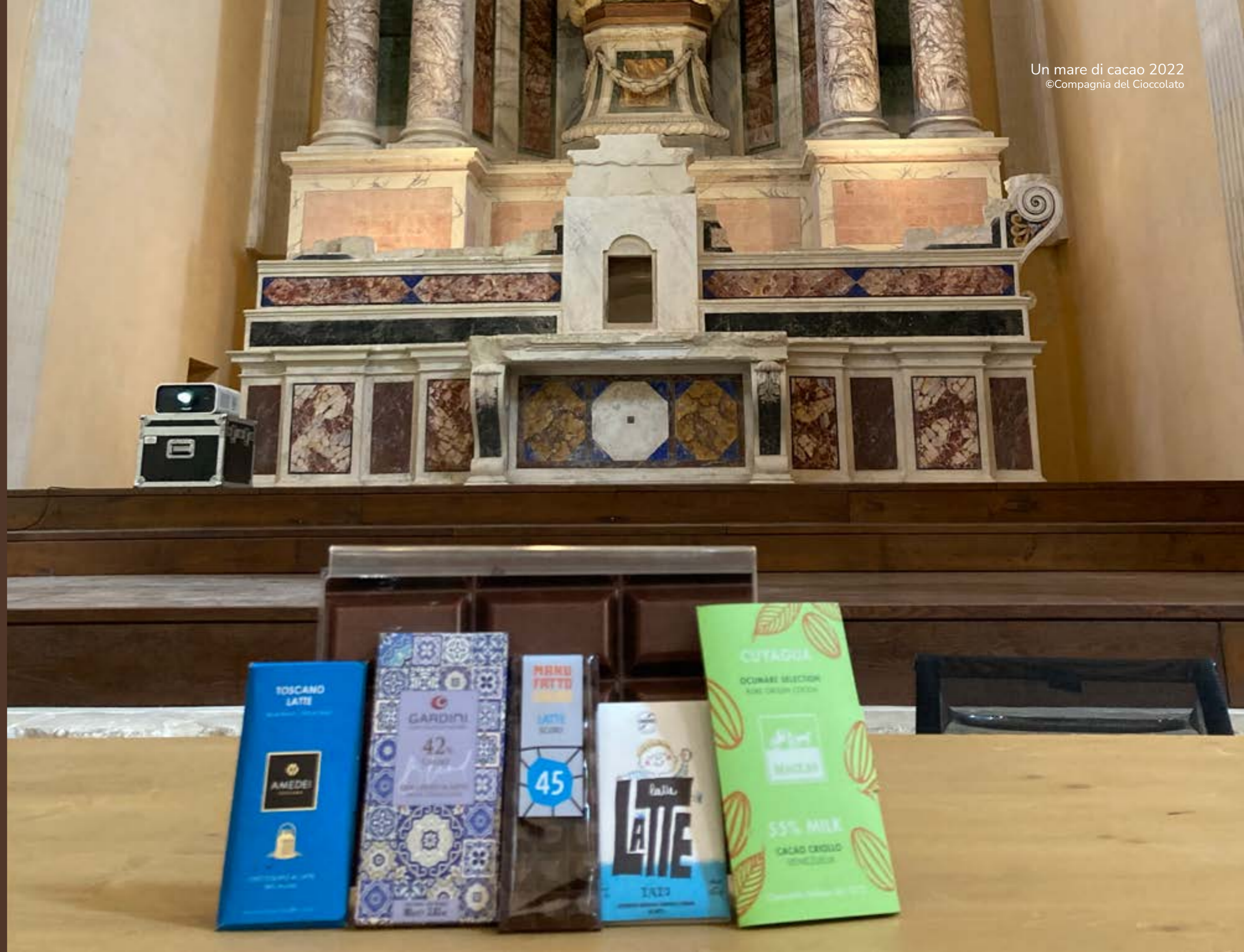
Le 5 tavolette al latte dei produttori presenti