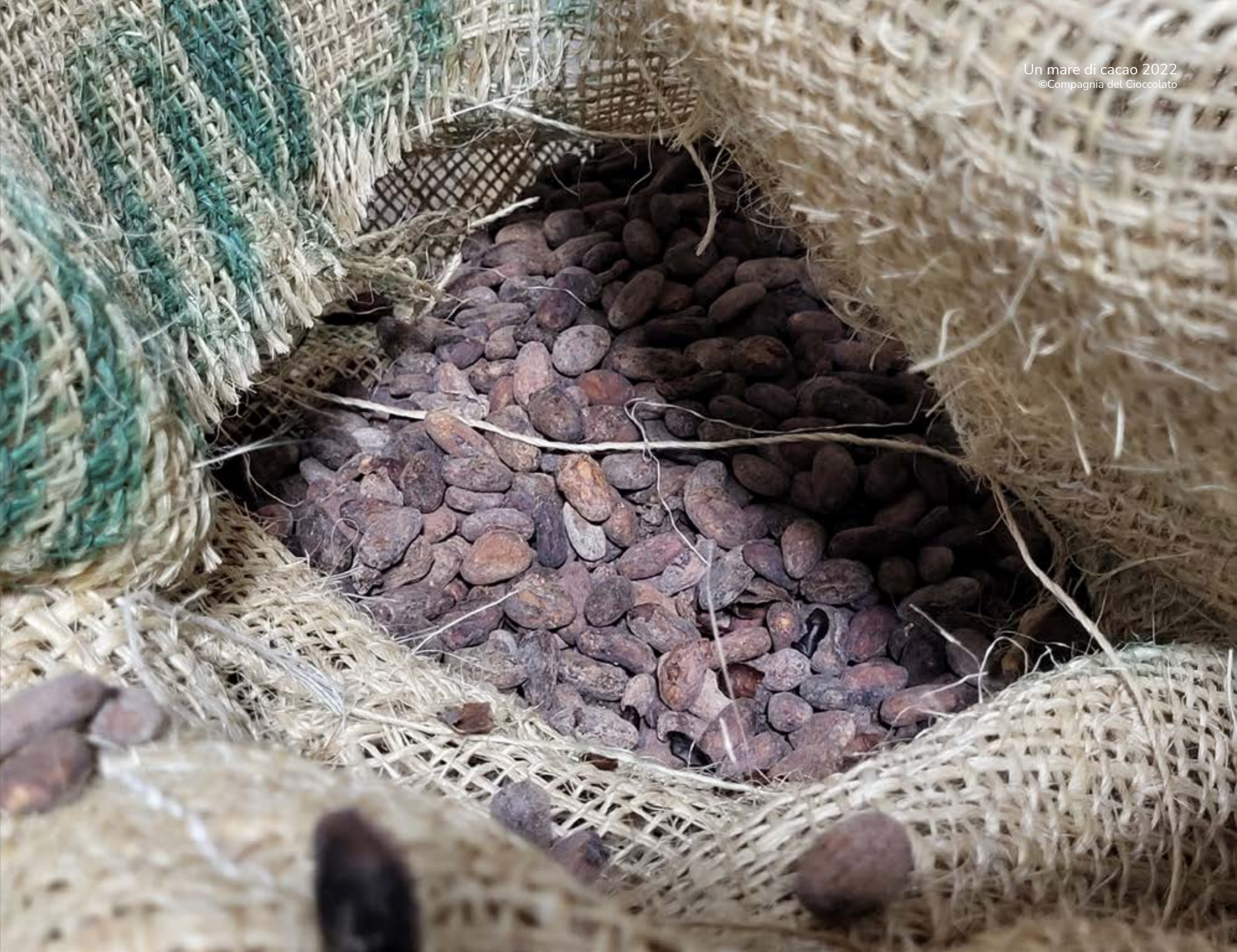
Fave nel sacco