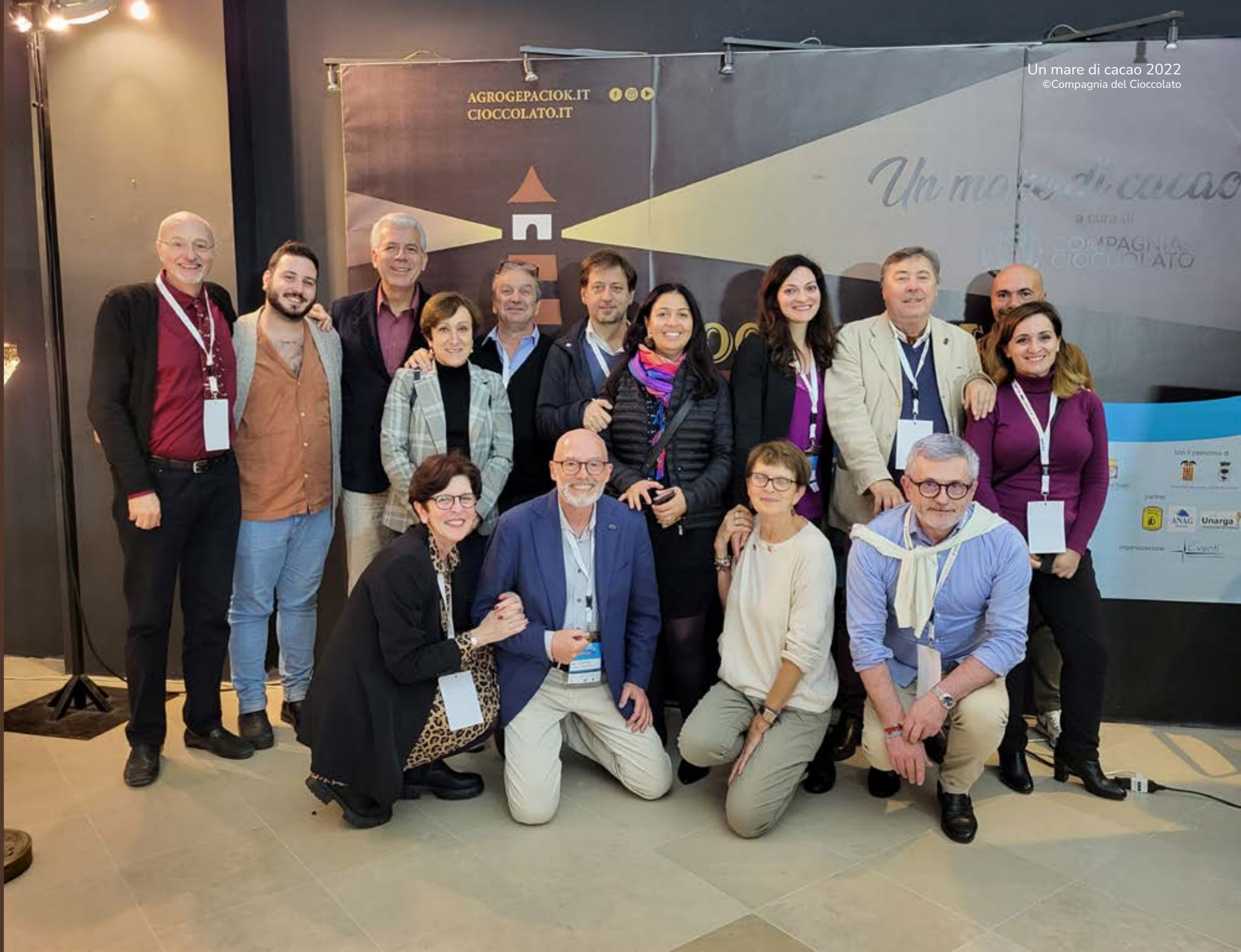
I chocolate taster di Compagnia e alcuni cioccolatieri