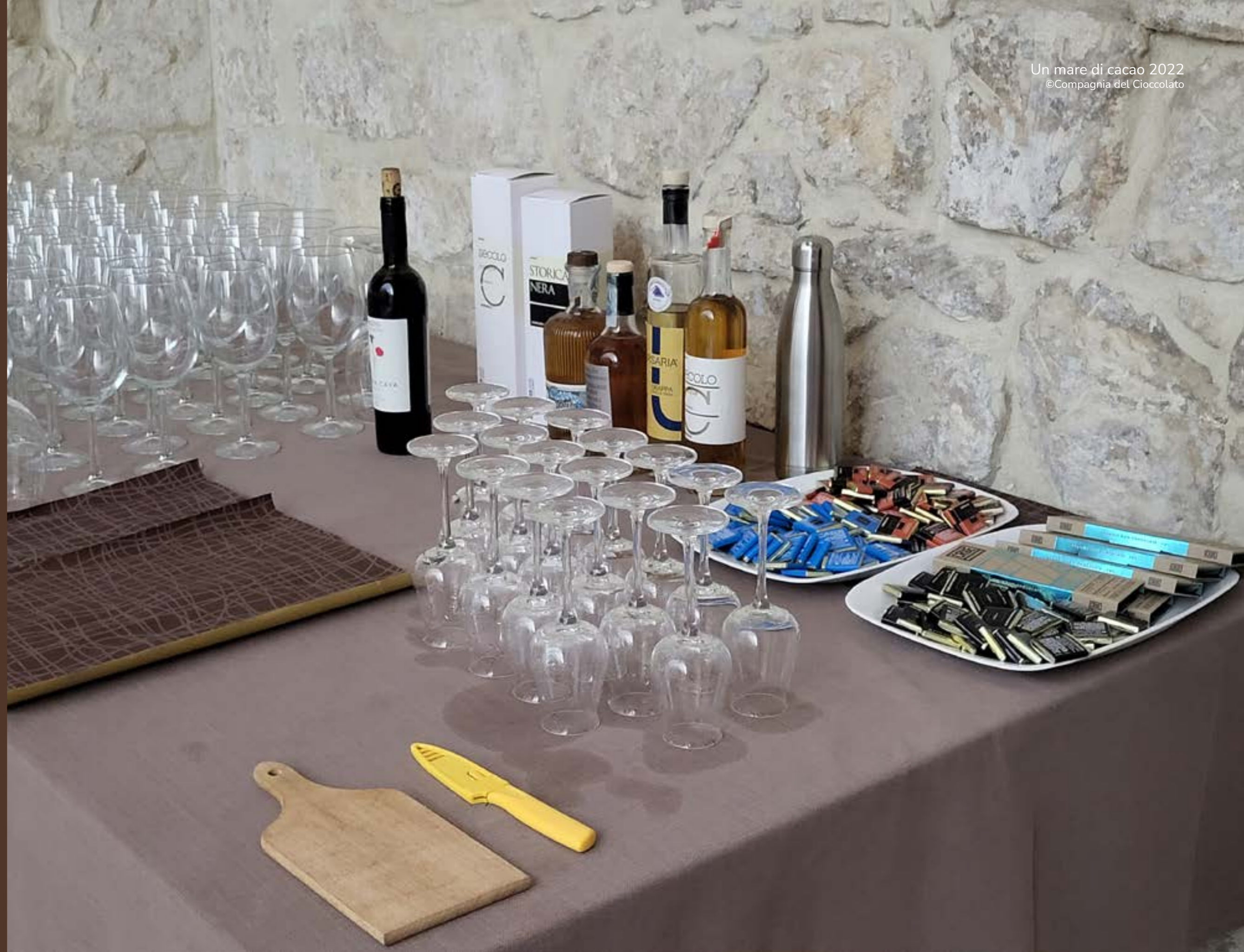
Preparativi in corso nella sala abbinamenti