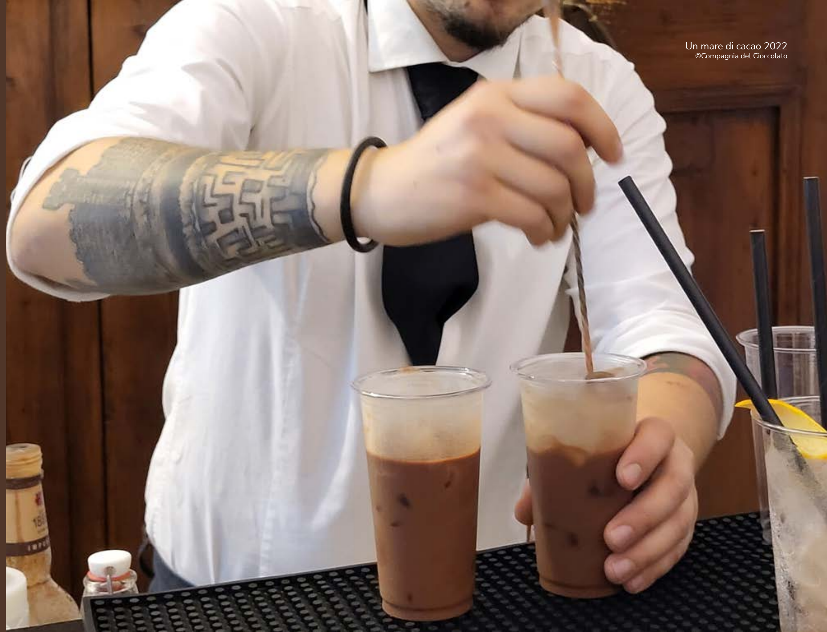
Angolo bar con cocktails al cacao