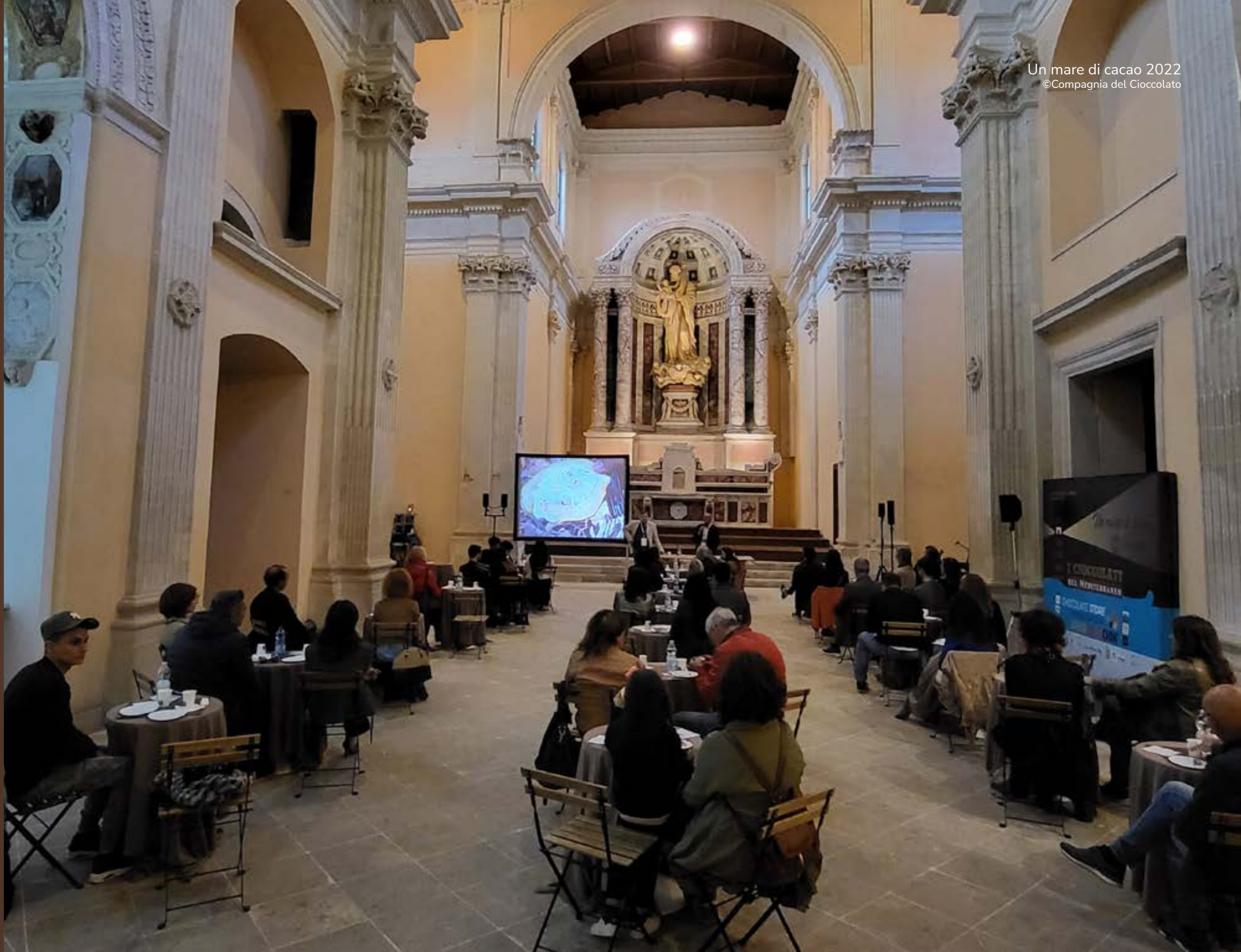
Degustazione in Sala Centrale