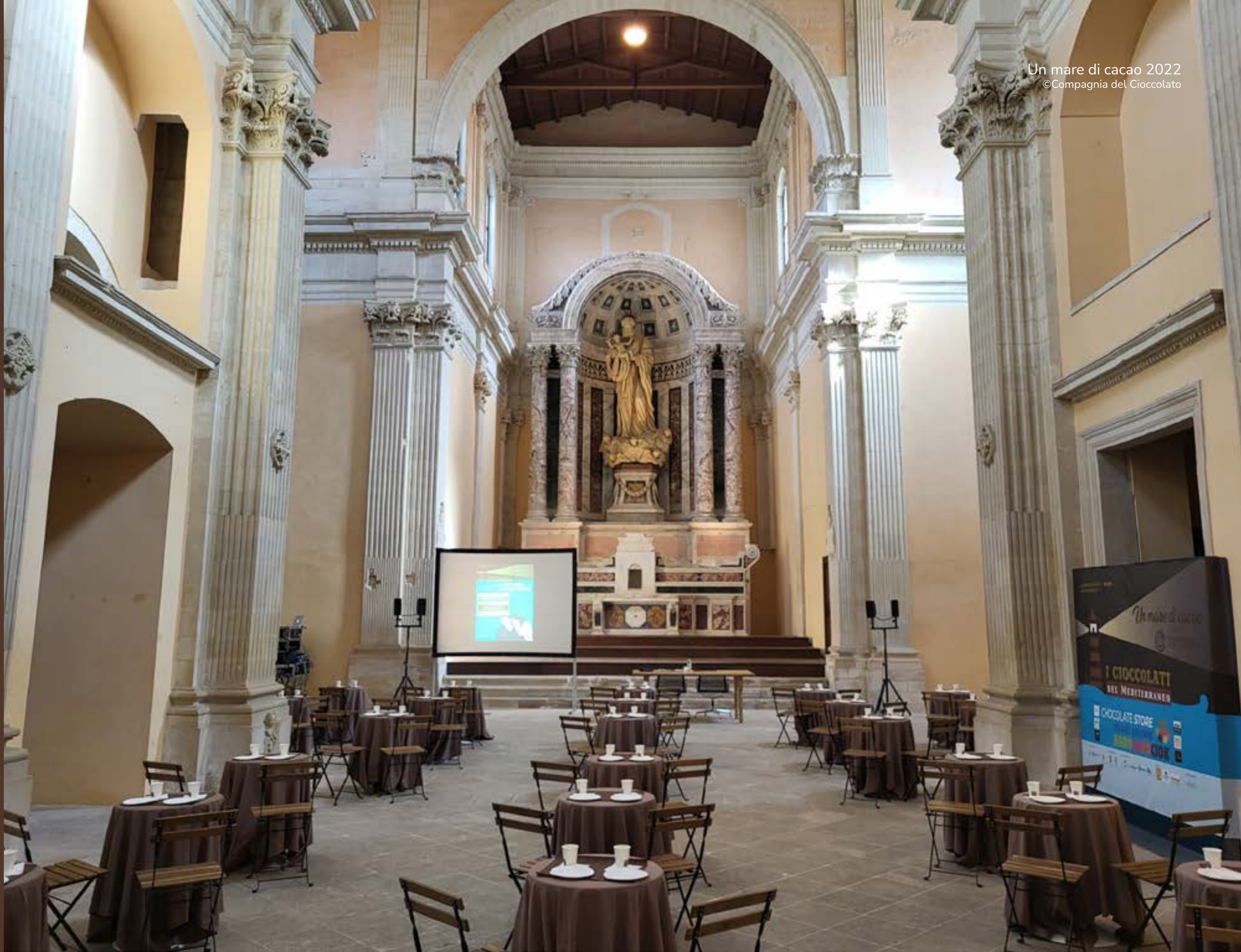
La sala principale