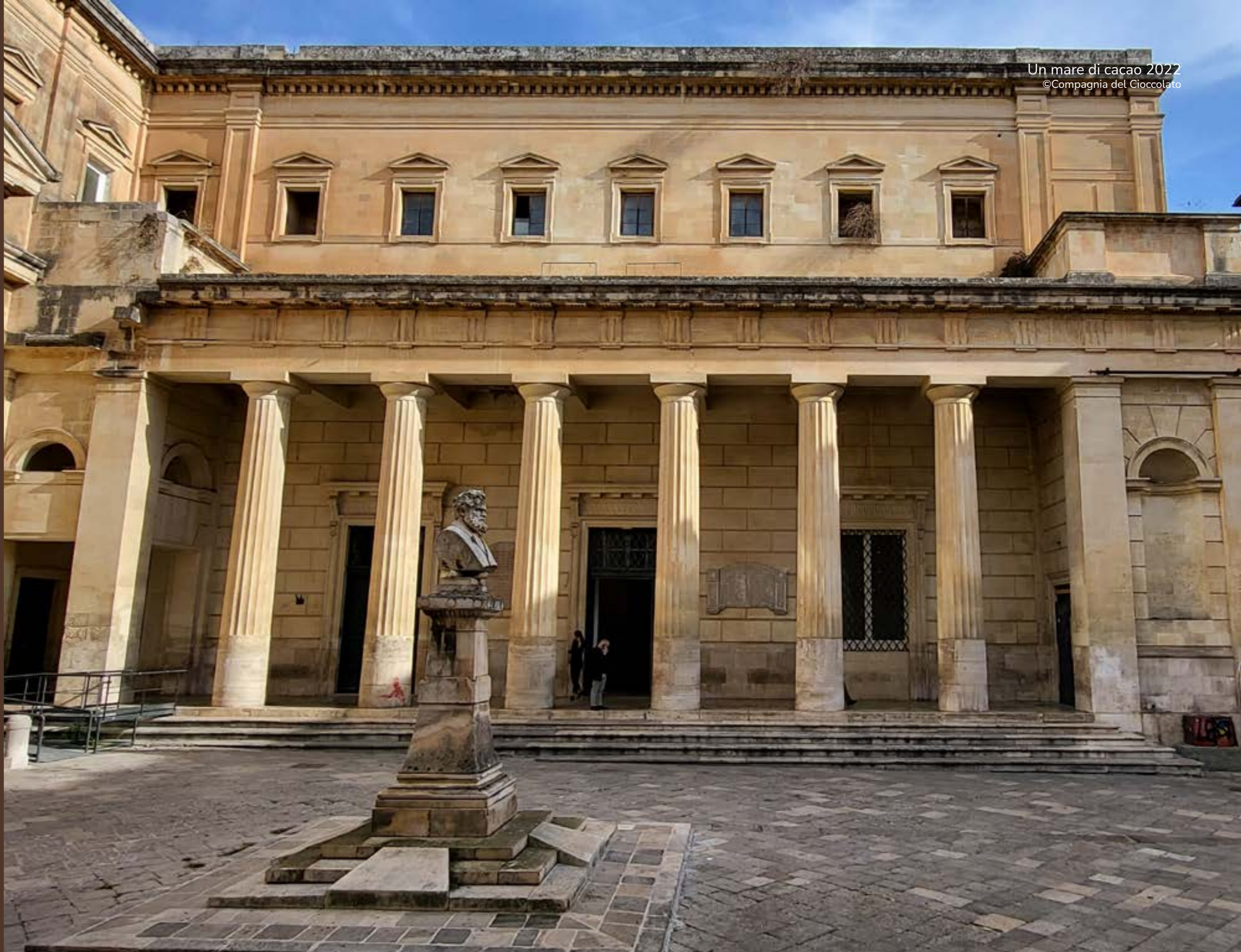
Chiesa di San Francesco della Scarpa sede di Un Mare di Cacao